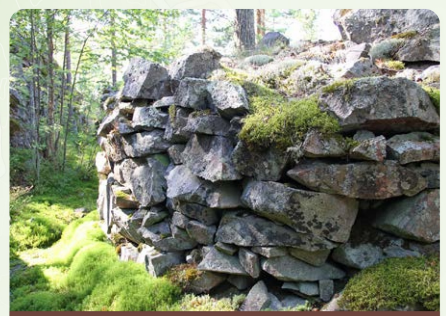
4. TEERNIEMEN LINNOITUKSET