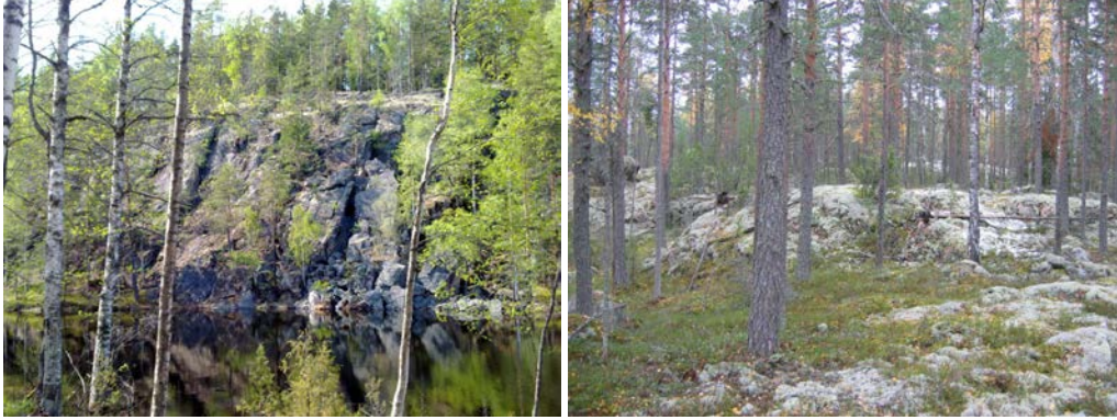
Hakalahden lounaiskulman jyrkänne ja Hakalahdenvuoren päällistä

Hakalahdenvuoren keskiosissa on muutama notkelma, joiden kautta ajotie on rakennettu. Notkelmissa on nuorta metsää ja tuoreen kankaan kasvillisuutta sekä yksi pienialainen suo, joka on muuttunut tien rakentamisen yhteydessä.