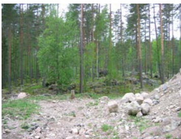
Yleiskuvaa T-1 alueen

T-2 alue sijaitsee Virransalmentien pohjoispuolella. Alue rajautuu idässä rakennettuun alueeseen, pohjoisessa metsään ja Hakalahdenvuoren kaakkoisjyrkänteeseen. T-2 alueen keskellä on rakennettua aluetta. T-2 alueen itäosassa, voimalinjan ja parkkialueen välissä on moreeni- ja kalliomäki. Kallion itäpuolella on teollisuusalue. Kallion laella kasvaa varttuneita mäntyjä. Muutoin alueen puusto on pääosin nuorta männikköä, jossa on paikoin varttuneita mäntyjä. Kasvillisuus on lähinnä puolukkatyyppiä ja kasvilajisto on niukkaa. T-2 alueen länsiosassa on kivikkoista mustikkatyyppin varttunutta männikköä, jossa sekapuina kasvaa muutama koivu. Metsä on valoisa, alikasvoksena on paikoin koivua, mäntyä ja katajaa. Kasvillisuus on tavanomaista mm. mustikkaa, puolukkaa, kanervaa, kieloa, metsätähteä ja vanamoja.