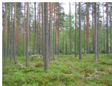
ja T-2 alueen rakentamattomista länsiosista