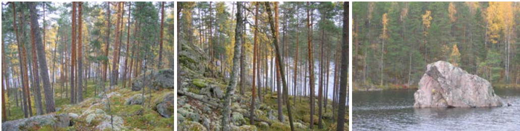
Susivahdinniemen rinteitä ja Hakalahden komea siirtolohkare

Susivahdinniemen alue rajautuu lännessä Hakalahteen, pohjoisessa ja idässä Sarkaveden eteläosan vesialueeseen sekä kaakossa ja etelässä teollisuusalueeseen. Susivahdinniemen lakiosat nousevat noin 35 metriä Hakalahtea korkeammalle ja sen rinteillä on useita rantamaisemassa näkyviä maisemallisesti arvokkaita jyrkänteitä. Susivahdinniemen ja Hakalahdenvuoren metsät eivät eroa merkittävästi toisistaan. Susivahdinniemen pohjois- ja keskiosat ovat pääosin kuivan ja kuivahkon kankaan varttuneita männiköitä. Alueen lounaisosassa, Hakalahden rantaan laskevassa rinteessä on myös nuorta mäntyvaltaista metsää. Hakalahden eteläpuolen varttunut metsää on harvennushakattu ja tie on rakennettu rantaan.