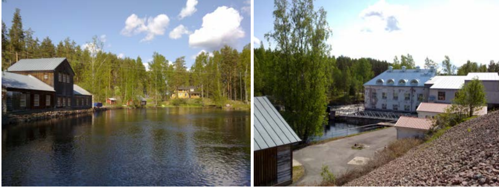
Kosken partaan huolella vaalittua ja entisöityä teollisuusmiljöötä